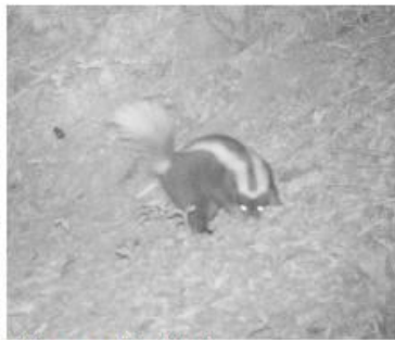
Chingue predio el Natri