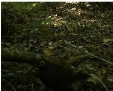
Hued Hued predio el Porvenir