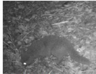
Guíña predio Elicura H-8