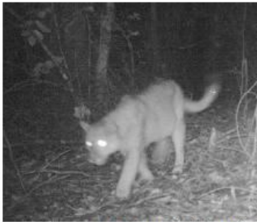
Pumas predio el Porvenir