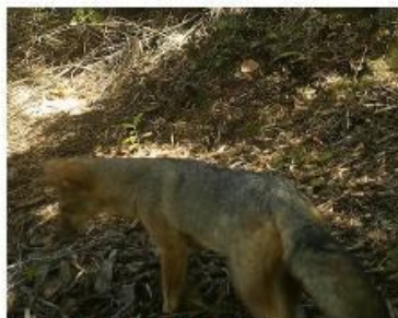
Zorro Culpeo predio el Natri