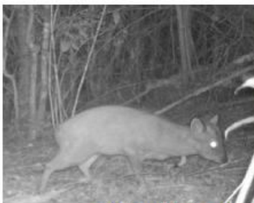
Pudu predio la Pascuala