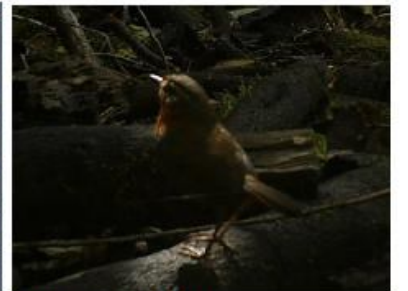
Chuca predio el Natri

Adicionalmente se ha preparado guías de identificación de especies como material de consulta para todo el personal y con esto contribuir al reconocimiento, conocimiento y conservación de flora y fauna presentes en el patrimonio.