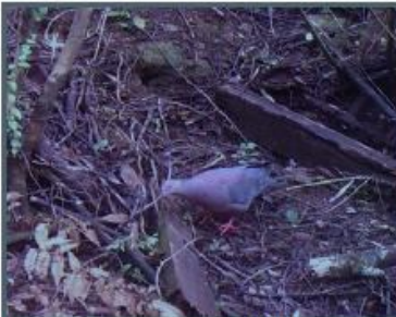
Torcaza predio El Porvenir