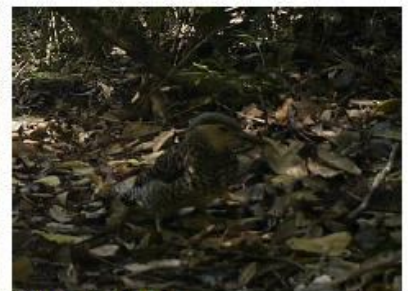
Pitio predio el Natri